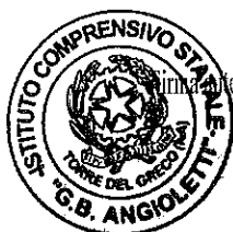
Immagine fotografata omissa ai sensi dell'art. 3 del D. Lgs. n. 39/1993